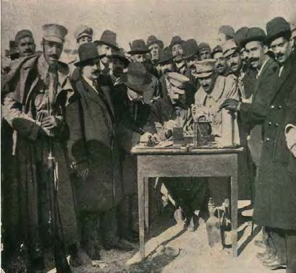
Fig.6 - Sidónio Pais assina a primeira proclamação ao País.

XIX e batizado em 1903 em honra do rei inglês Eduardo VII, que havia visitado Lisboa nesse ano para reafirmar a aliança luso-britânica. Foi no alto deste parque, com vista desafogada sobre a Avenida e o centro da cidade, que Sidónio Pais estabeleceu o seu posto de comando.