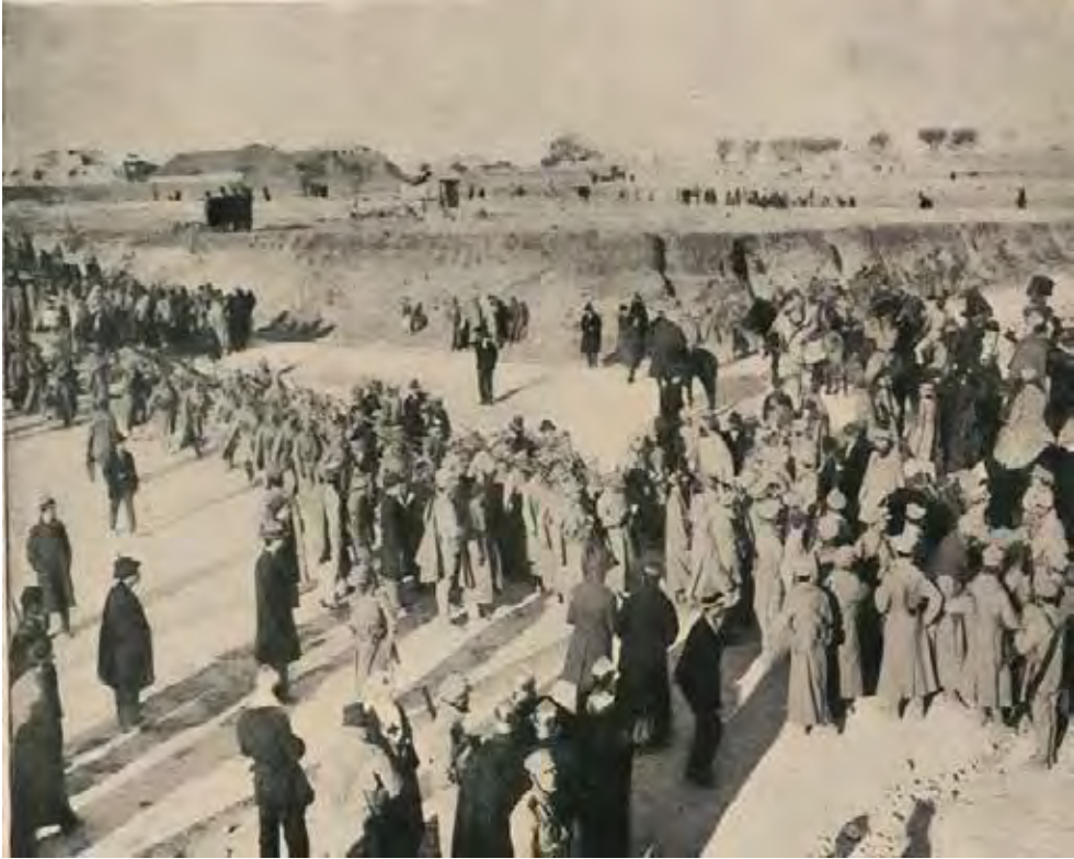
Fig.4 - Chegada de forças de Infantaria ao acampamento dos revoltosos.