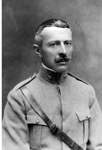
Fig.2 - Sidónio Pais envergando uniforme de oficial do Exército, da arma de Artilharia. 1917.

Na noite de quarta-feira, 5 de Dezembro de 1917, Lisboa adormecia como qualquer outra noite de inverno. Sidónio Pais, que usava o uniforme pela primeira vez em anos, vestiu-o num quarto arrendado na Rua Gomes Freire, nas proximidades da Escola de Guerra. Dali partiu à frente de uma modesta força inicial de apenas quarenta efectivos do Regimento de Cavalaria 7 — unidade aquartelada em Lisboa — sob o comando do Alferes Pessoa de Amorim.