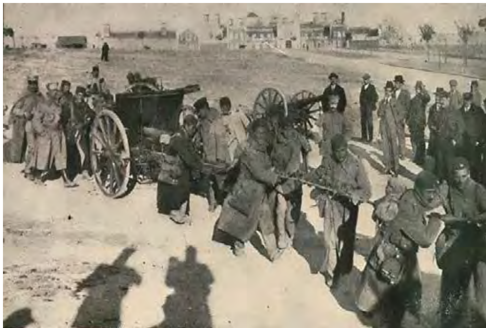
Fig.5 - Colocação em posição das peças de Artilharia no acampamento dos revoltosos.

Ainda nessa noite, as bocas de fogo do Regimento de Artilharia 1 bombardearam os navios de guerra do Governo que estavam ancorados no Tejo, um sinal inequívoco de que a revolução seguia o seu rumo sem hesitações. Ao longo das horas seguintes, outras unidades foram sublevadas ou aderiram espontaneamente ao movimento: Infantaria 5, Infantaria 16 e o Batalhão de Infantaria 33 — este último, proveniente de Lagos, encontrava-se em Lisboa a aguardar embarque para a França e recusou partir, aderindo em massa à causa revolucionária.