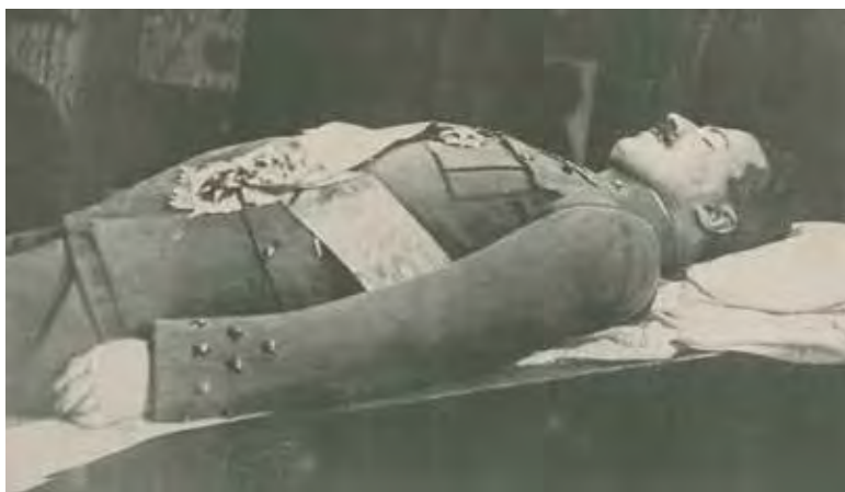
Fig. 15 - Sidónio Pais no leito mortuário.

O regime terminou de forma abrupta e violenta. Na noite de 14 de Dezembro de 1918 — exactamente um ano após a consolidação do seu poder — Sidónio Pais deslocou-se à Estação do Rossio para apanhar o comboio para o Porto. Foi aí que José Júlio da Costa, ex-sargento do Exército filiado no Partido Democrático, disparou contra ele um tiro fatal. O Presidente-Rei morreu poucas horas depois, no Hospital de São Luís dos Franceses.