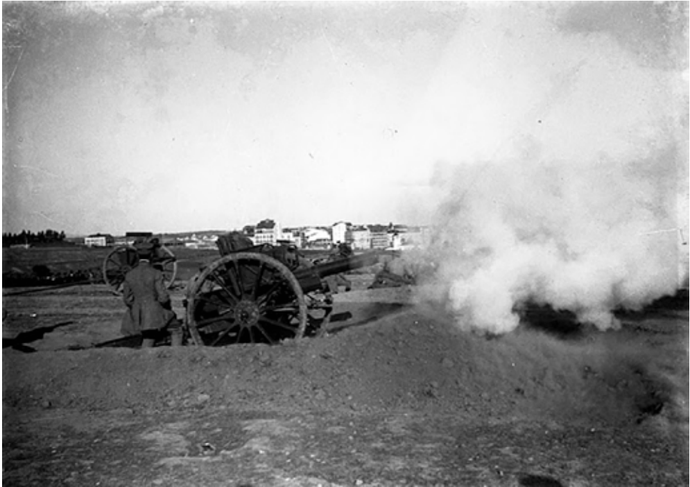
Fig.10 - Artilharia Sidonista em acção.

Esse pedido não chegou ao destino. Um grupo de revolucionários que controlava os serviços telegráficos tinha sabotado todos os dispositivos de comunicação telegráfica que permitiam a ligação de Lisboa ao resto do país. A unidade de artilharia de Santarém nunca chegou a partir; a unidade de infantaria de Mafra, que chegou a iniciar marcha para Lisboa depois de tomar conhecimento dos acontecimentos, acabou por aderir à revolução. Entretanto, em Viseu, o herói da Rotunda de 1910, Machado Santos, preparava-se para marchar sobre Lisboa à frente de unidades militares da Beira, mas a capitulação governamental chegaria antes que essa força pudesse ser necessária.