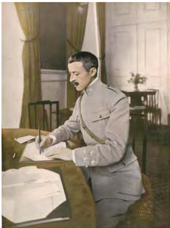
Fig.12 - Sidónio Pais Presidente da República.

A 8 de dezembro, o suplemento do Diário do Governo proclamou oficialmente a vitória da revolução, com uma nota assinada por Sidónio Pais em nome da Junta Revolucionária. A 10 de dezembro, deu-se a consagração simbólica do triunfo: um desfile maciço e disciplinado das tropas vitoriosas pela Avenida da Liberdade de Lisboa, e ao país, a imagem de uma transição que se pretendia definitiva. A 11 de dezembro tomou posse o 15.º governo republicano, chefiado por Sidónio Pais e integrando três unionistas, dois centristas e um independente.