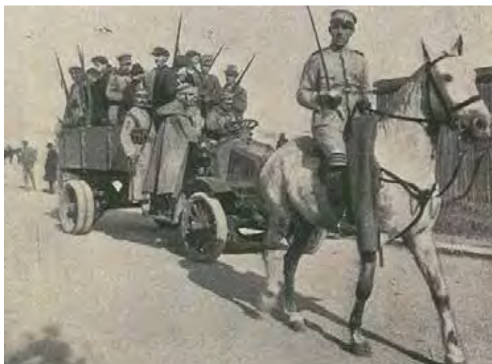
Fig.14 - Camioneta transportando civis e militares revoltosos.

O papel dos civis foi igualmente significativo. Centenas de cidadãos de diferentes classes sociais — trabalhadores sindicalizados da UON (que apoiaram a revolta em troca da libertação de companheiros detidos por crimes sociais), pequenos proprietários, intelectuais afetos ao Integralismo Lusitano, grupos habituados à violência política da Primeira República — participaram ativamente nos combates, operaram as barricadas civis e bloquearam o avanço das colunas governamentais.