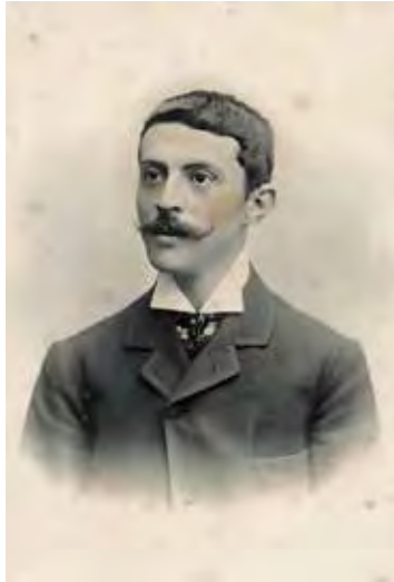
Fig.1 - Sidónio Bernardino Cardoso da Silva Pais aos 27 anos. c. 1899.

Era neste quadro de profunda insatisfação que emergiu a figura que haveria de mudar o curso da República: o Major Sidónio Bernardino Cardoso da Silva Pais.