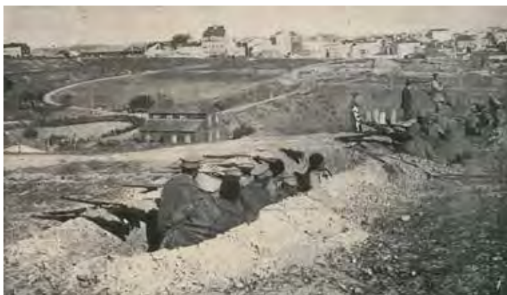
Fig.7 e 8 – Artilharia e Infantaria instaladas no terreno.

Os navios do Governo — em particular o cruzador Vasco da Gama, ancorado no Tejo — bombardeavam periodicamente as posições revoltosas com as suas peças de 203 mm, mas sem efeito decisivo. A artilharia revoltosa respondia. Ao longo de todo o dia 6, não se vislumbraram movimentos ofensivos significativos das forças governamentais. Norton de Matos e Leote do Rego, entrincheirados no Arsenal da Marinha, tentavam organizar uma resposta, enquanto aguardavam informações dos observadores no terreno e a chegada reforços que permitissem organizar algum tipo de resposta armada.