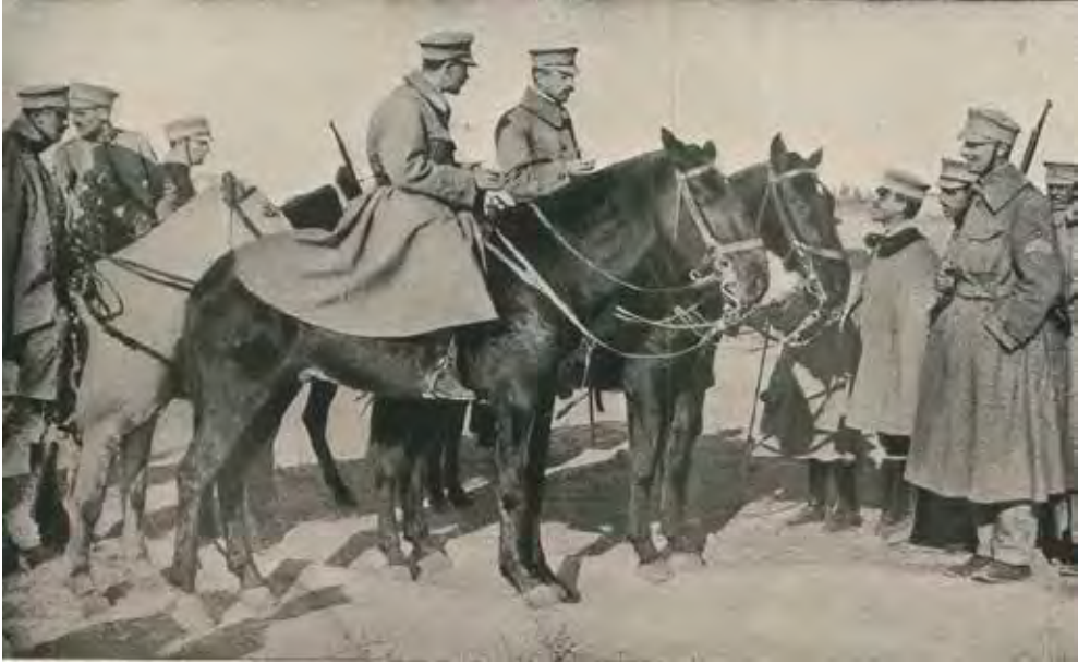
Fig.9 – Sidónio Pais percorre as posições das forças instaladas no Parque Eduardo VII.