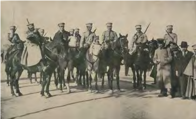
Fig.13 - Oficiais revoltosos.