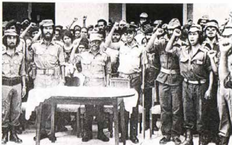
Fig. 3 - Proclamação da independência de Timor-Leste pela FRETILIN. Ao centro Xavier do Amaral, ladeado à sua direita por Nicolau Lobato e, à esquerda, Rogério Lobato.

para que obrigasse à retirada das tropas indonésias de Timor-Leste.