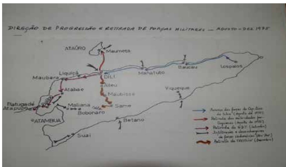
Fig. 2 - Movimentação das diversas forças militares entre Agosto-Dezembro de 1975. Adaptação do autor.

A guerra civil centrou-se, durante o mês de Agosto, no controlo de Díli. A UDT tinha o Palapaço (Oeste) como área de operações, enquanto a FRETILIN se posicionou em Taibessi (Este). Pelo meio situava-se a “zona neutra” do bairro militar e do porto, onde estavam o Governo de Timor e a sua componente militar. O confronto decidiu-se ao longo das artérias que ligavam os dois “centros operacionais”, marcado por trocas de tiros, disparo de morteiros, combates corpo-a-corpo, avanços e recuos, rusgas, prisões e assassinatos. Díli ficou entregue à carnificina, numa luta sem quartel. Perante o vislumbre da derrota, alguns líderes da UDT fugiram para Kupang, num barco indonésio. Os elementos fixados no Palapaço retiraram, primeiro para a área do heliporto, depois para Comoro e de seguida para o alto de Raikoto.